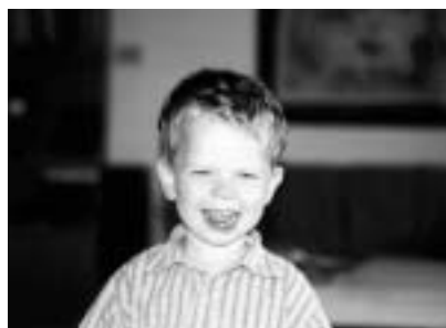
Kind sein braucht unsere Pflege

Der Berufsverband Kinderkrankenpflege Deutschland (BeKD) e.V. bietet Fortbildungen im Bereich Kinderkrankenpflege und andere Weiterbildungsmöglichkeiten an.